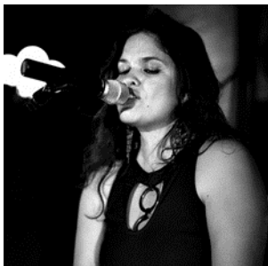
26 juillet // MISTYSA