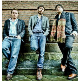
12 juillet // TCHA-BAJO