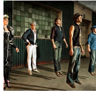
19 juillet // OZTARA