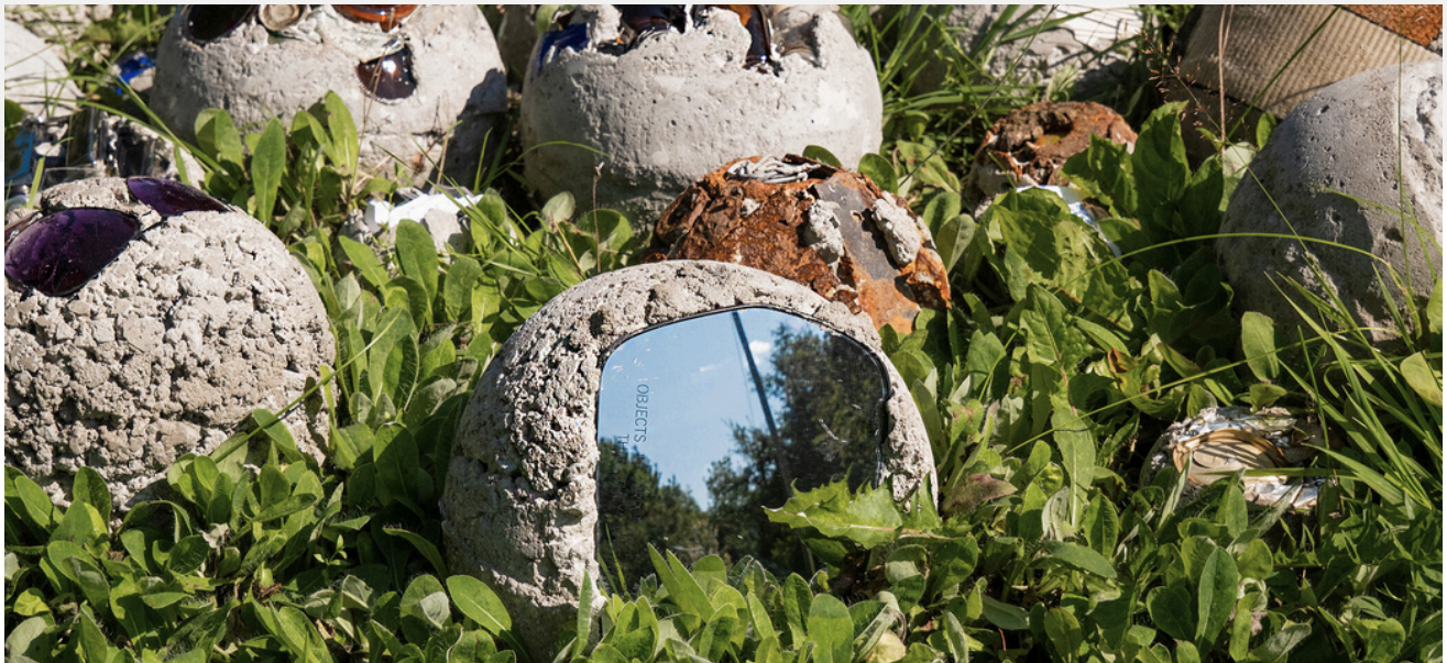
Détail de l'œuvre Anthroposphères de Ernst Perdriel - 2023

L'événement Les Jardins Réinventés de la Saint-François est une manifestation artistique extérieure d'envergure prenant cadre dans notre saison estivale et au cours de laquelle des créateurs et créatrices élaborent des installations éphémères qui s'intègrent à la nature. Les artistes sélectionné-es réalisent, en partie en atelier et en partie sur le site, une installation non permanente s'inspirant du lieu, le parc de la Rive, et d'une thématique. De plus, des expositions se tiennent chaque année en parallèle, à l'intérieur de la Maison des arts et de la culture de Brompton, en lien avec cette même thématique.